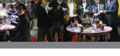
同事熱心參與「安全猜燈謎」遊戲。