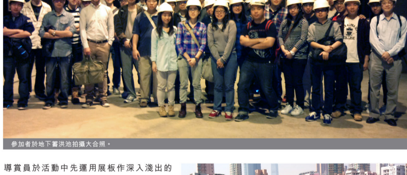
參加者於地下蓄洪池拍攝大合照。

香港渠務署於2013年3月7日舉行大坑東蓄洪池導賞活動，新福港同事反應踴躍，約有30人參與。