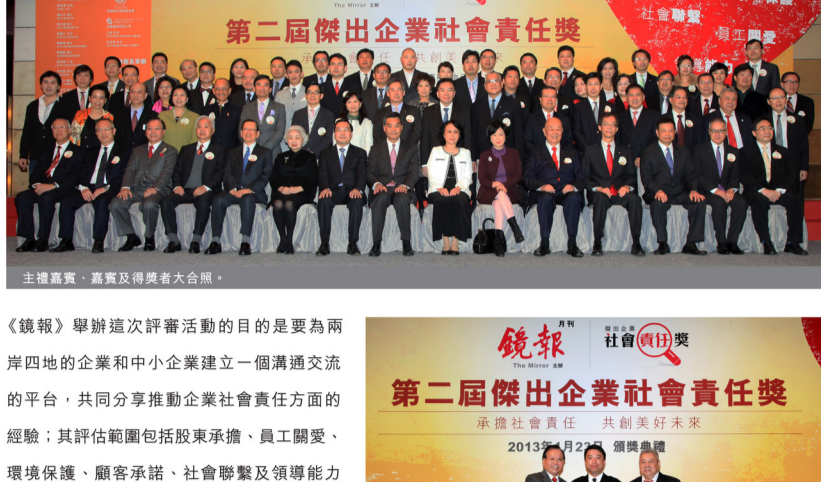
主禮嘉賓、嘉賓及得獎者大合照。

新福港集團連續兩年獲《鏡報》月刊頒發「傑出企業社會責任獎」，再次肯定了集團於履行社會責任方面的努力。是次頒獎典禮於本年度1月23日在北角海逸君綽酒店宴會廳舉行，並邀得香港特別行政區行政長官梁振英先生擔任主禮嘉賓。