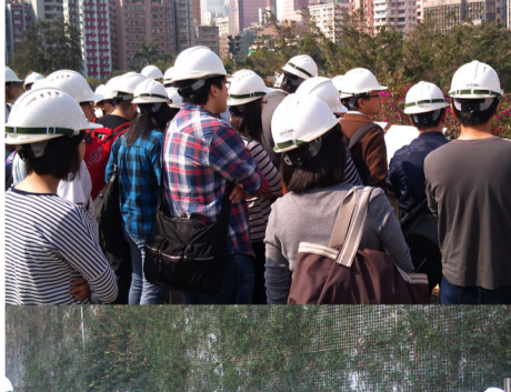
參加者在導賞員帶領下參觀了「大坑東蓄洪池計劃」中的各項設施。

「大坑東蓄洪池計劃」為現時本港最大的蓄洪池，其容量達到10萬立方米。該項渠道改善計劃由渠務署管理，目標為防止過多的地面徑流匯入排水系統及解決西九龍區，包括旺角、油麻地、大角咀、深水埗及大坑東於大雨後常出現的水浸問題。